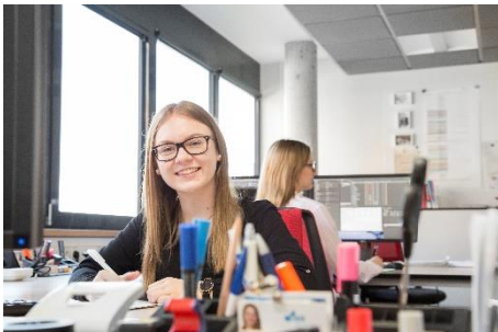
Kaufleute im Gesundheitswesen