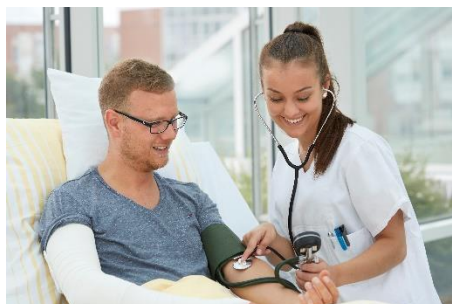
Pflegfachfrau/-mann (3 Jahre) Pflegefachhelfer (1 Jahr)