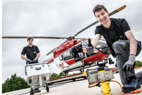
Elektroniker für Betriebstechnik