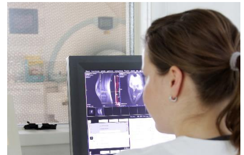
Medizinische Technologen für Radiologie