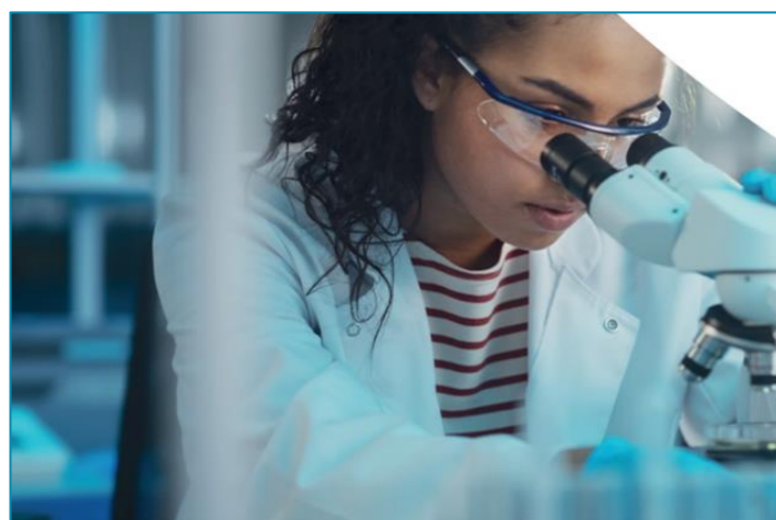
Med. Technologen f. Laboratoriumsanalytik