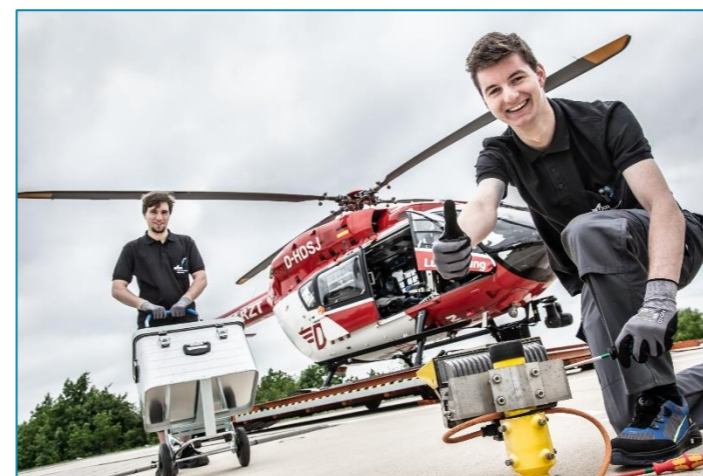
Elektroniker für Betriebstechnik