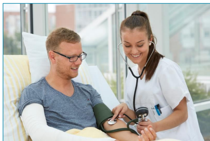
Pflegefachfrau / -mann